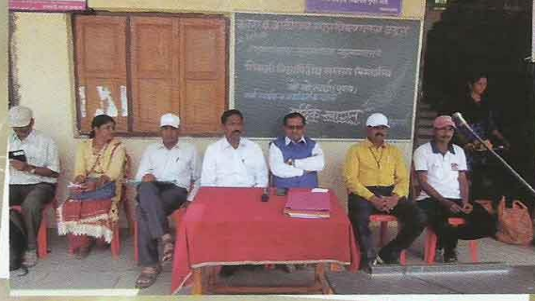
शिवाजी विद्यापीठ सातारा विभागीय खो-खो स्पर्धा (पुरुष)