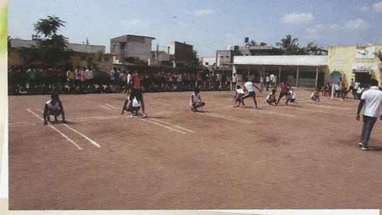
खो-खो स्पर्धेत खेळत असलेले महाविद्यालयाचे खेळाडू