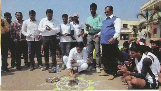
जिल्हा खो-खो स्पर्धेचे उद्घाटन करताना प्राचार्य पोतदार