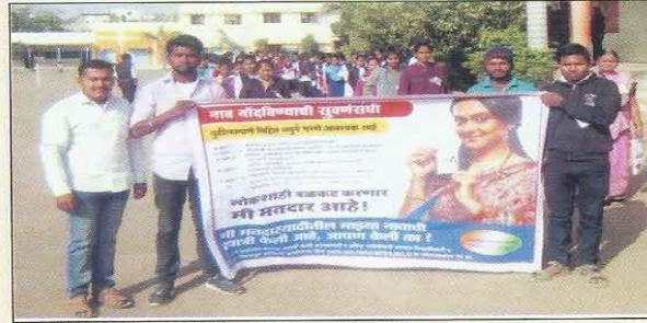
“मतदान जागृती फेरी” महाविद्यालयीन विद्यार्थी