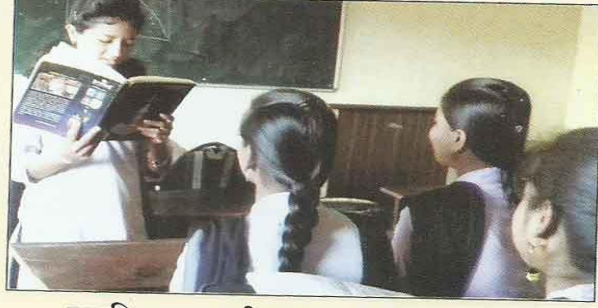
सामुहिक वाचन, बी.ए.भाग -१, मधील विद्यार्थी