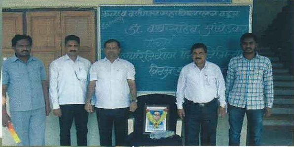
डॉ. बाबासाहेब आंबेडकर जयंती साजरी करताना प्राचार्य व प्राध्यापक वर्ग