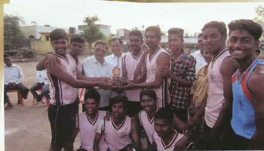
विजेत्या खेळाडूंना ट्रॉफी देत असताना प्रा. रिंटे सर