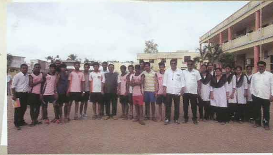
जिल्हा खो-खो स्पर्धेत सहभागी खेळाडू