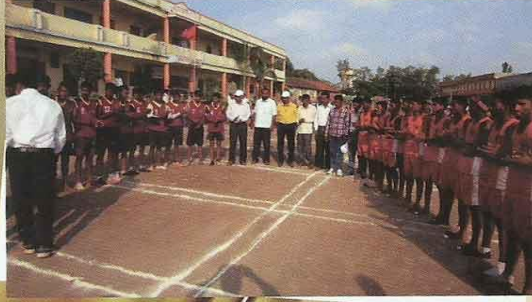
खो-खो स्पर्धेच्या उद्घाटन प्रसंगी खेळाडू व पंच