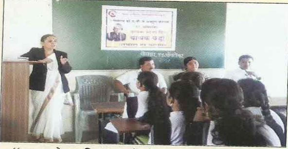
“वाचक प्रेरणा दिन”, मार्गदर्शन करताना सौ.माने बी.बी.