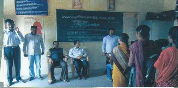
संविधान दिन राज्य घटनेची प्रस्ताविका करताना प्रा. कठरे डि:एन.